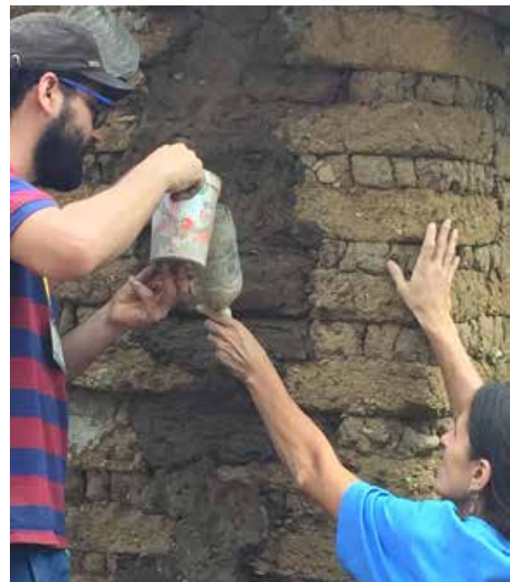
Figura 11. Inyección de lechadas de tierra, estabilizada con cal. Taller realizado en Huayapam, Oaxaca, durante el Seminario Iberoamericano de Arquitectura y Construcción con Tierra (SIACOT-2019).