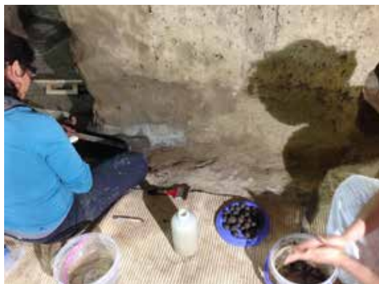
Figura 5. Para recuperar la volumetría del adoratorio prehispánico del Mictlantecuhtli, en El Zapotal, Veracruz, la tierra aplicada mediante capas sucesivas sobre papel japonés se compensó con arena para aumentar su porosidad.

Pero a lo largo de la historia se ha buscado dar mayor durabilidad, dureza y resistencia a las condiciones naturales de la arquitectura de tierra, por lo que adicionalmente se han utilizado diferentes tipos de aglutinantes o refuerzos mecánicos, como sucede por ejemplo con la paja, el estiércol, los aceites, las proteínas, azúcares o consolidantes químicos, que no sólo favorecen la adherencia, sino también le confieren a las obras la consistencia necesaria para resistir la erosión eólica, hídrica y antrópica (Avila y Guerrero, 2018).