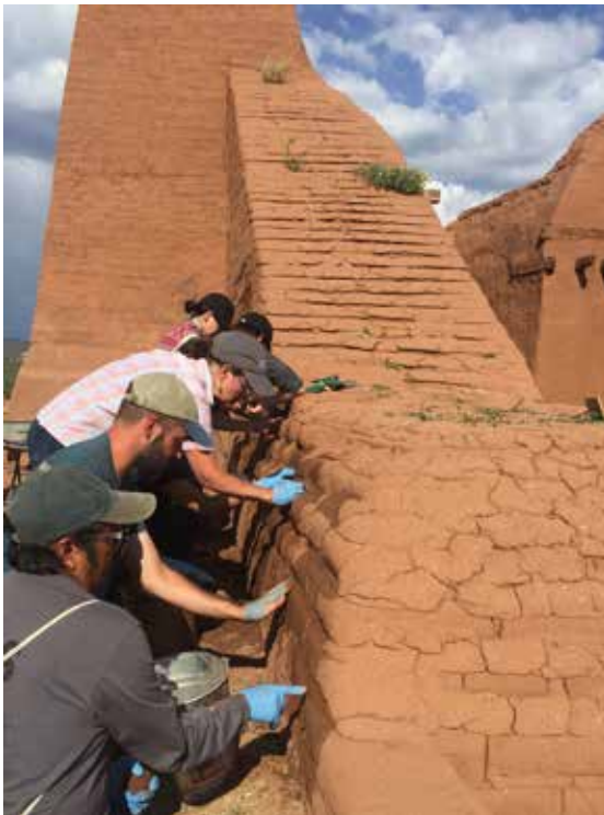
Figura 12. Implementación de la técnica de integración durante el Taller Internacional de Conservación y Restauración de Arquitectura (TICRAT-2018) en Pecos, New Mexico, USA.

Ávila, E. y Guerrero, L. (2018). El mucílago de Opuntia Ficus como estabilizante en recubrimientos de tierra. En Memorias del SIACOT-2018 (pp. 115-126). Guatemala: