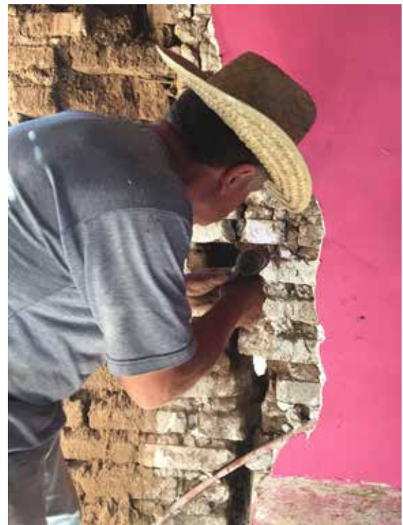
Figura 8. Taller de restauración organizado por Cooperación Comunitaria, en Ixtepec, Oaxaca.

Es por esto que las actividades de conservación preventiva son cruciales, puesto que permiten identificar fallas en momentos en los que su restablecimiento es más sencillo e implica menor volumen de obra.