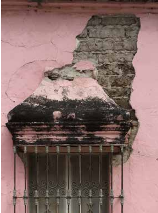
Figura 1. Degradación de los adobes por el encapsulamiento de la humedad derivada del aplanado de cemento. Tepecoacuilco, Guerrero. (Foto: L. Guerrero).

Estos graves problemas se empezaron a manifestar a finales del siglo pasado, en estructuras que habían sido consolidadas o recubiertas con resinas plásticas o con cemento (Ver Figura 1). Esos materiales, que habían dado resultados aceptables en la construcción convencional, empezaron a mostrar efectos colaterales a consecuencia del sellado de los poros de las obras tradicionales y la resultante acumulación de agua y sales solubles en los sustratos, proceso que progresivamente provocó pérdidas lamentables en el patrimonio que se pretendía proteger (Guerrero, Correia y Guillaud, 2012).