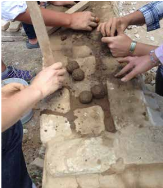
Fig. 9. Se elaboran esferas con tierra lo más parecida posible a la del sustrato original y sólo con la humedad necesaria para darles forma. Coordinación Nacional de Conservación del Patrimonio Cultural (INAH). (Foto: L. Guerrero).

La prefabricación de estas esferas ayuda a densificar parcialmente el material que se va