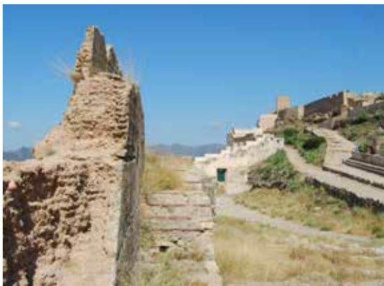
Figura 6. Las murallas medievales de Sagunto, España, se realizaron con la técnica llamada “tapia calicostrada” en la que se emplea tierra compactada con hidróxido de calcio. (Foto: L. Guerrero).

Sin embargo, como fue demostrado desde los años sesenta, la cantidad de cal que se requiere para que funcione el sistema es mínima –nunca más del 10% en peso seco–, pues volúmenes