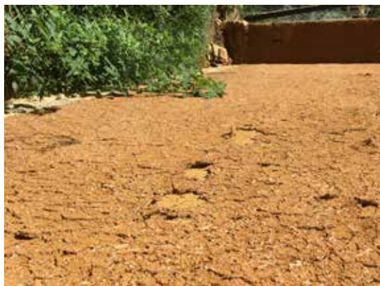
Figura 3. Los revoques realizados con tierras arcillosas que no son adecuadamente compensadas con arena, acaban por desprenderse. Chilón, Chiapas.

que no se ven alterados ante la presencia del agua. Por ello son las partículas encargadas de mantener el equilibrio estructural de la tierra, al funcionar como una especie de “esqueleto” del sistema (Ver Figura 3).