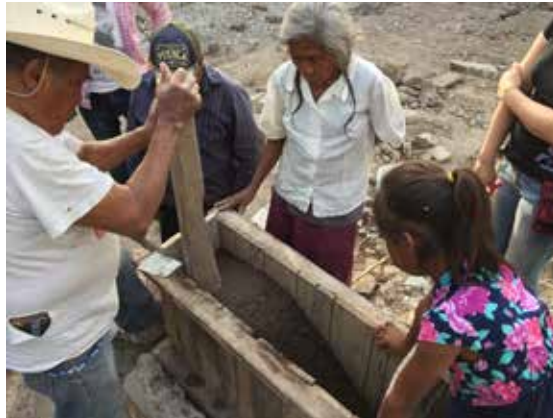
Figura 2. Taller comunitario de restauración y recuperación de viviendas dañadas por los sismos del 2017, en Huehuetlán El Chico, Puebla.

En general se acepta que el papel que desempeñan estos componentes se puede categorizar en dos grupos. Las gravas, arenas y limos, se componen de cristales de diversas formas, pero con una elevada estabilidad físico química, de manera