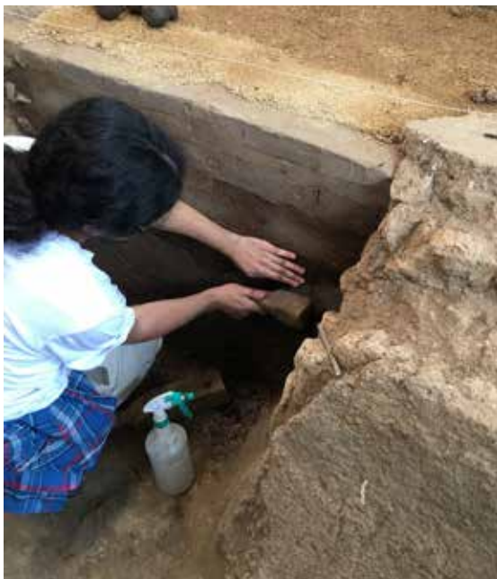
Fig. 10. Compactación con un pequeño mazo de madera de esferas de tierra estabilizada con cal, durante la restitución volumétrica de la estructura de La Palangana en Kaminaljuyú, Guatemala. (Foto: L. Guerrero).

Para este procedimiento, será necesario que durante el relleno y compactación del área externa de la grieta se inserten “boquillas” hechas con tramos de tubos de plástico, PVC o mangueras delgadas, colocadas de forma equidistante en toda la extensión de la falla. Una vez que se cierra el exterior de la grieta, se inyecta la lechada fluida dentro de cada boquilla partiendo siempre de las inferiores, hasta llegar a las más altas conforme se observe que se va rellenando el interior del núcleo. Por último, se extraen las boquillas y se sella por completo la intervención.