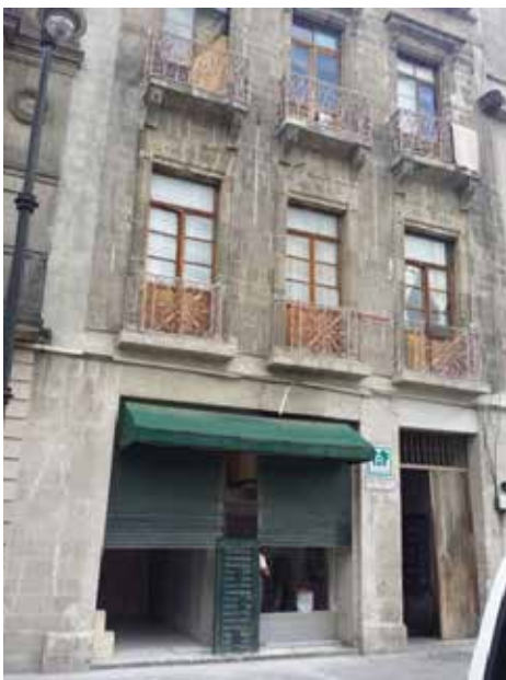
Figura 5. Edificio en remodelación en República de Guatemala Archivo personal. Los materiales que se están utilizando, no son los adecuados para realizar una restauración del edificio.