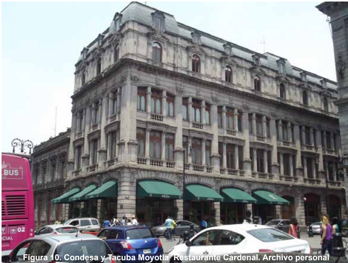
Figura 10. Condesa y Tacuba Moyotla Restaurante Cardenal.