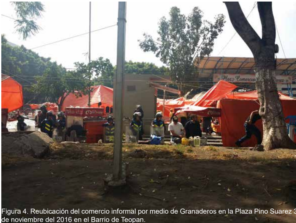
Figura 4. Reubicación del comercio informal por medio de Granaderos en la Plaza Pino Suarez 3 de noviembre del 2016 en el Barrio de Teopan.