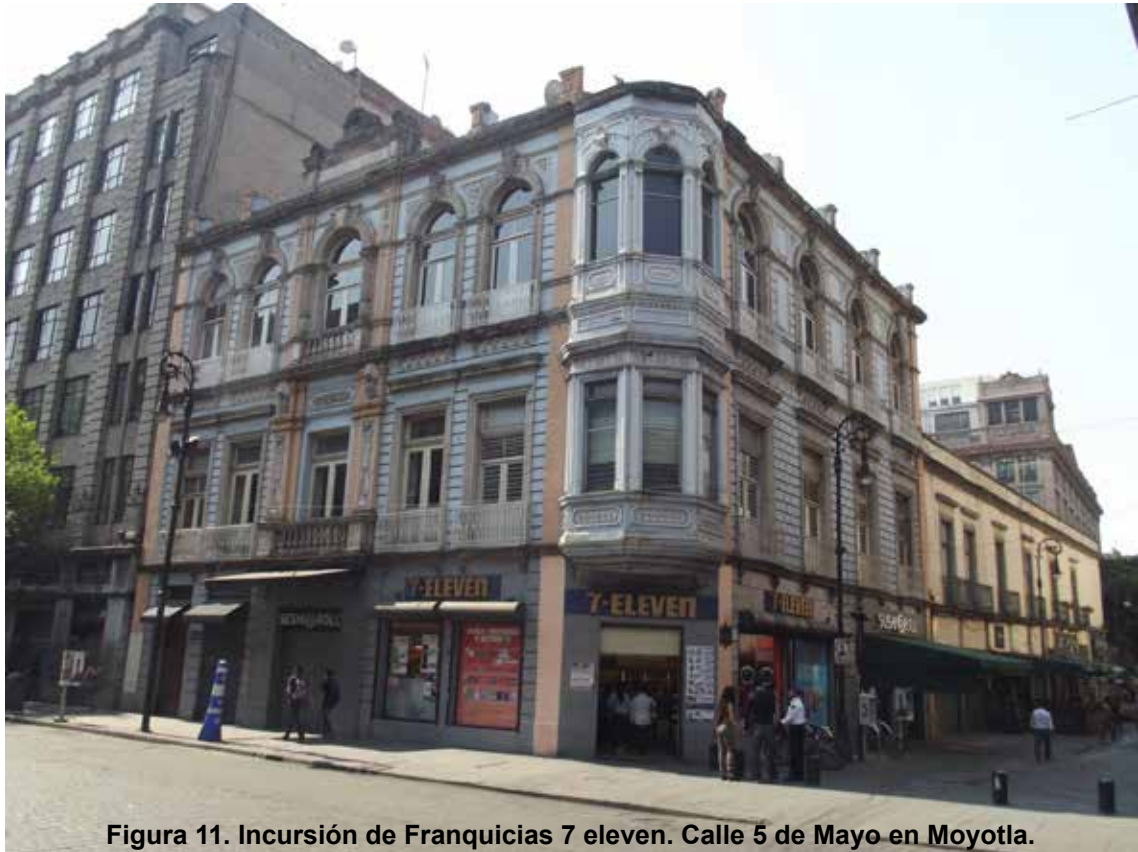
Figura 11. Incursión de Franquicias 7 eleven. Calle 5 de Mayo en Moyotla.