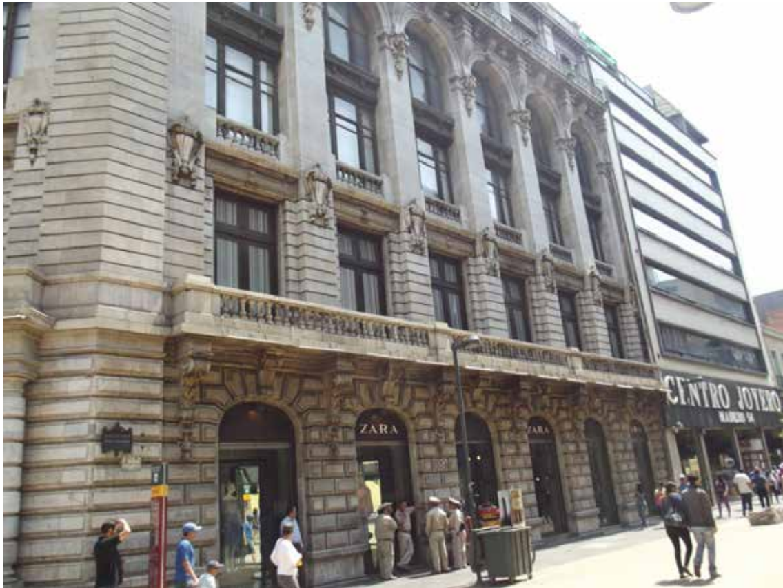
Figura 9. Madero e Isabel La Católica Moyotla . Archivo personal