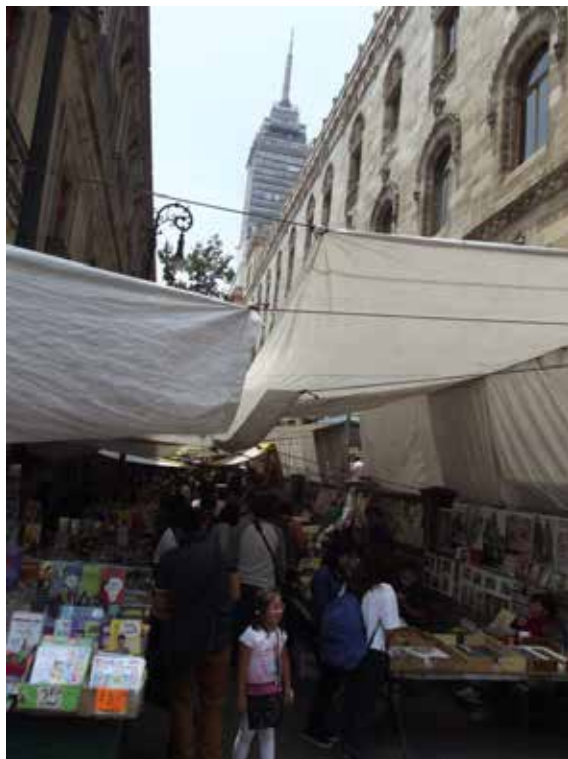
Figura 7. Callejón Condessa Moyotla Comercio ambulante.

pueden integrar en talleres participativos a futuro, en esta investigación las mismas presentan similitud en todos los casos, donde en ningún momento se menciona nada sobre la ciudad estética y bella, sin embargo en general, en el discurso de los actores se identifica una sociedad desigual y asimétrica contenida en dicho espacio, lo que introduce rutas analíticas para la reflexión en donde la preocupación por la equidad es predominante en todos los discursos y consecuencia misma es la estética del lugar puesto que la sociedad es el espíritu de lo urbano y lo estético y su conjunción con la forma conforma una avenencia del objeto estético.