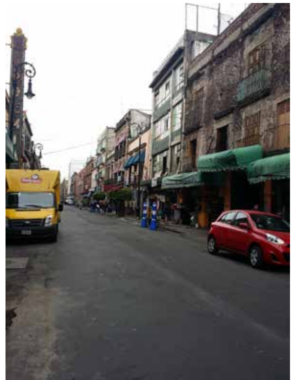
Figura 8. El comercio ambulante daña el patrimonio.

Es constante la palabra deterioro y abandono seguido por la palabra regeneración, aprovechamiento, y en otros casos repoblamiento. Por lo tanto, se identifica un imaginario colectivo