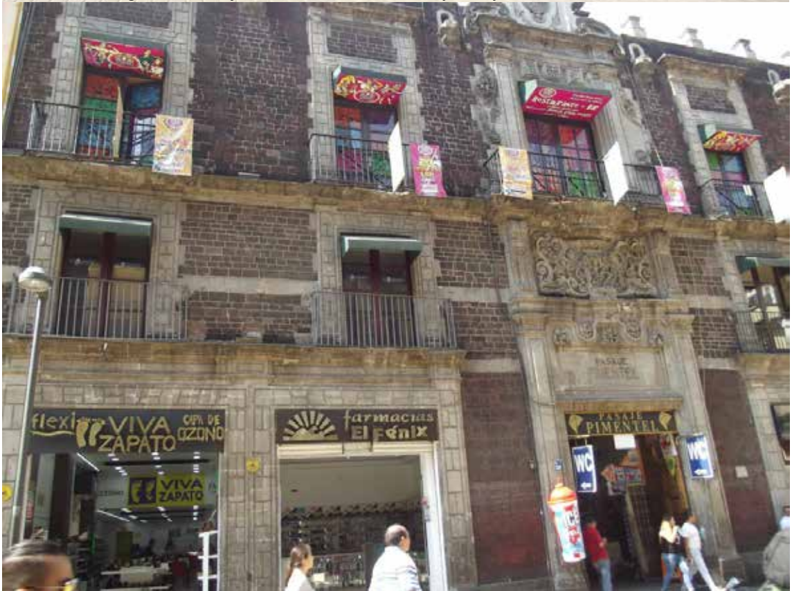
Figura 2. Pasaje Pimentel. Calle Motolinea. Barrio Moyotla.