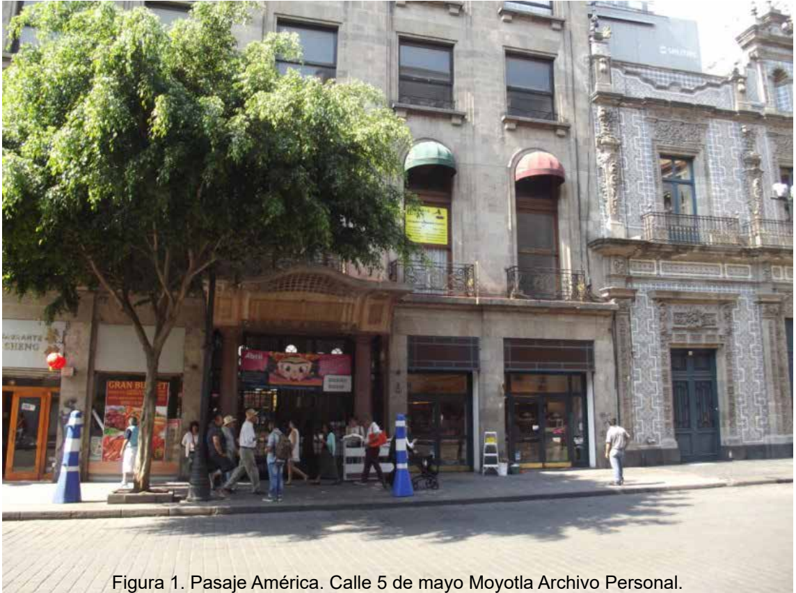
Figura 1. Pasaje América. Calle 5 de mayo Moyotla Archivo Personal.