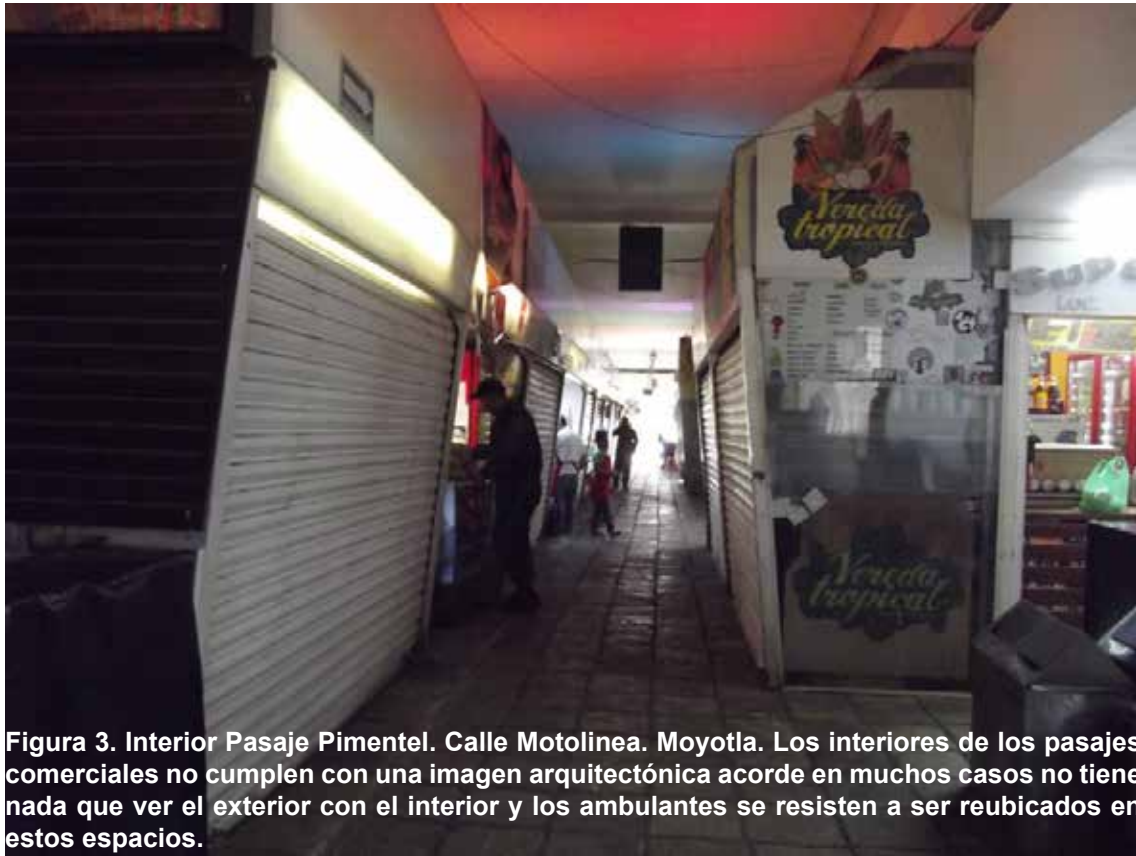
Figura 3. Interior Pasaje Pimentel. Calle Motolinea. Moyotla. Los interiores de los pasajes comerciales no cumplen con una imagen arquitectónica acorde en muchos casos no tiene nada que ver el exterior con el interior y los ambulantes se resisten a ser reubicados en estos espacios.