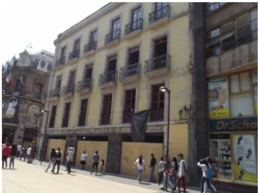
Figura 6. Madero e Isabel La Católica Moyotla.