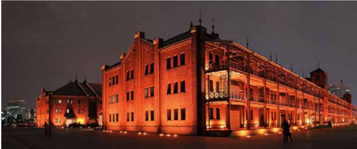
Figura 2. Yokohama Red Brick Warehouse, Yokohama, Japón.