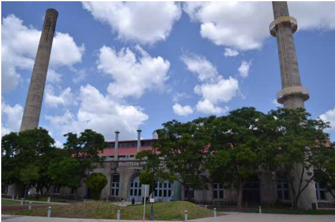
Figura 5. Restauración de la Casa de Fuerza, hoy Biblioteca Pública Central.