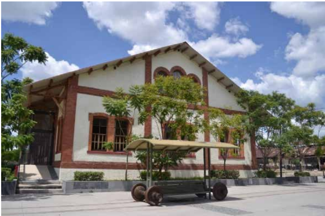
Figura 14. Universidad de las Artes.