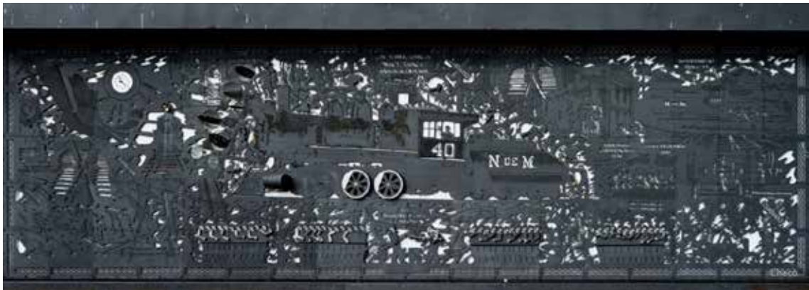
Figura 3. Escultura al ferrocarril mexicano. Muestras las costumbres y sitios emblemáticos de aquella época. Adaptado de ©xchecox, 2014.

historia ferroviaria de Aguascalientes, su patrimonio e identidad. Así mismo, para abordar el tema del patrimonio industrial, se tomó como referencia la bibliografía de Álvarez-Areces (2008).