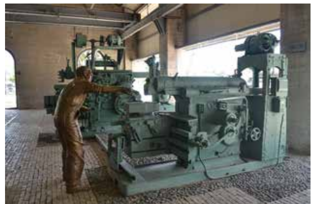
Figura 9. A la izquierda: restauración del Antigua Taller de Locomotoras. Su arquitectura se consideraba sobresaliente. A la derecha: Escultura de rielero: demuestra las formas laborales durante la época ferroviaria.