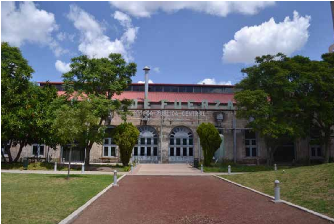
Figura 13. Biblioteca Pública Central. Edificio importante, debido a su arquitectura y a que en éste se encontraba el silbato que daba aviso del inicio y fin de la jornada laboral. Aún conserva el letrero “Casa de Fuerza”.