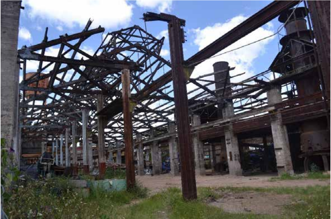
Figura 17. Taller Nacional de Gráficos. Construido en honor al importante grabador aguascalentense: José Guadalupe Posada. Fotografía captada el 11-09-2016