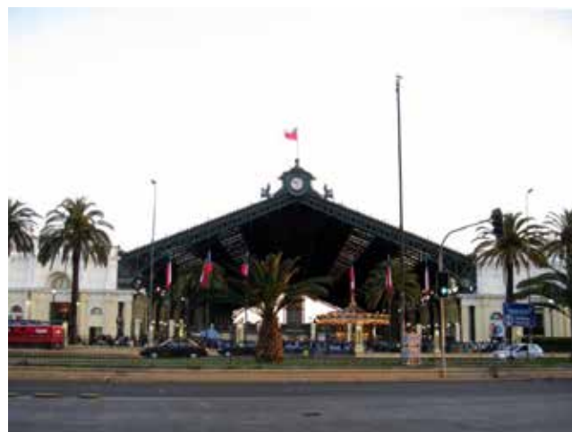
Figura 1. Estación Central, Santiago de Chile.

El artículo permitió evaluar cómo la evidencia histórica existente en el patrimonio puede generar motivación por la conservación. Para lo cual, se detectaron aquellas evidencias percibidas por los habitantes, y, por ende, la efectividad de la intervención urbana realizada al Complejo Ferrocarrilero. A través de la búsqueda bibliográfica, se encontraron dos principales estudiosos de la época ferrocarrilera en Aguascalientes: Acosta (2010) y Barba (2013), quienes han centrado sus investigaciones en la