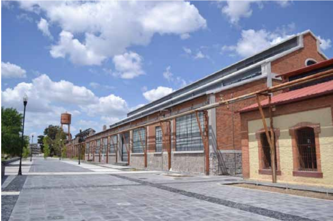
Figura 19. Taller Nacional de Gráficos. Construido en honor al importante grabador aguascalentense: José Guadalupe Posada. Fotografía captada el 11-09-2016