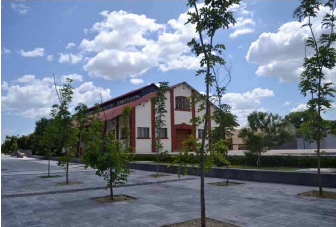
Figura 15. Escuela de Danza.