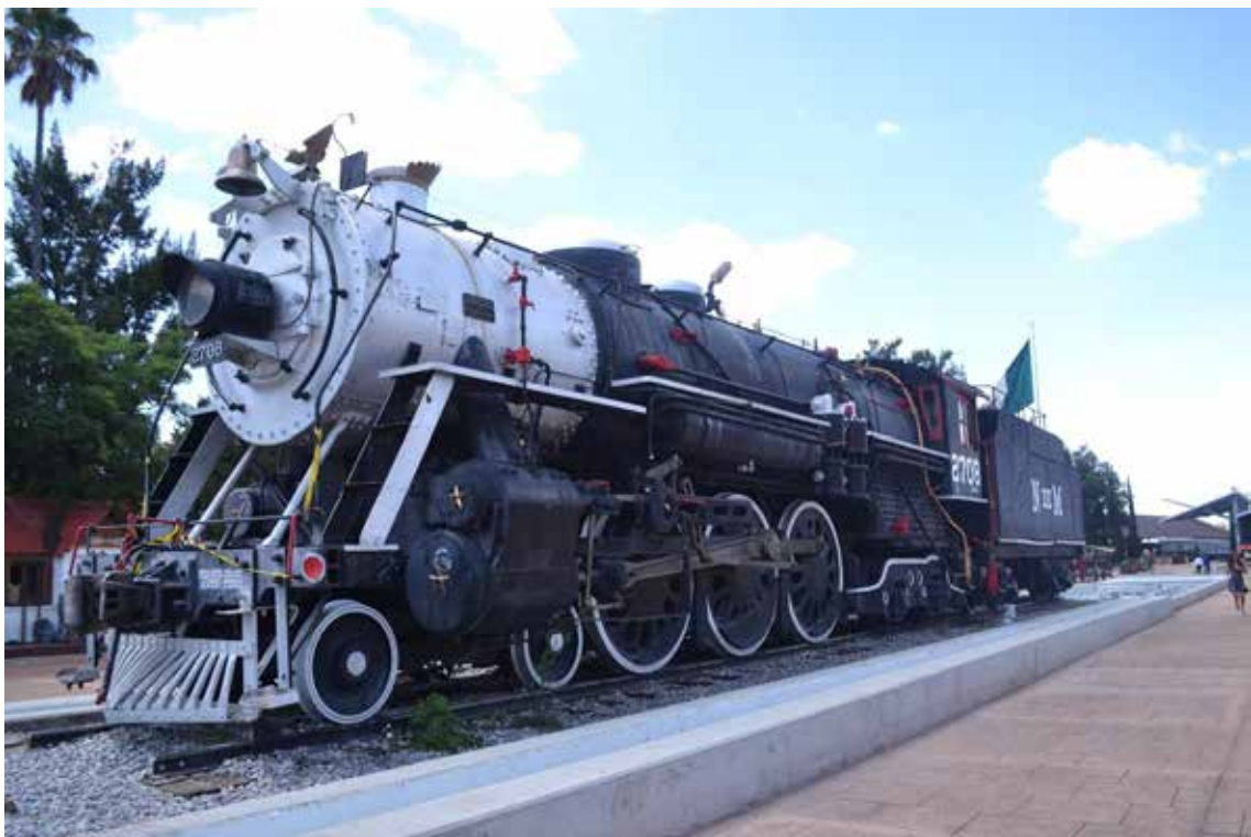
Figura 7. Tren con movimiento a base de vapor. “La Hidrocálida”: indica el fin de la era ferroviaria.

No sólo se han renovado espacios, también se han construido y desarrollado espacios que permitan lograr la integración social, cumpliendo con el único requisito impuesto para reincorporar los terrenos del