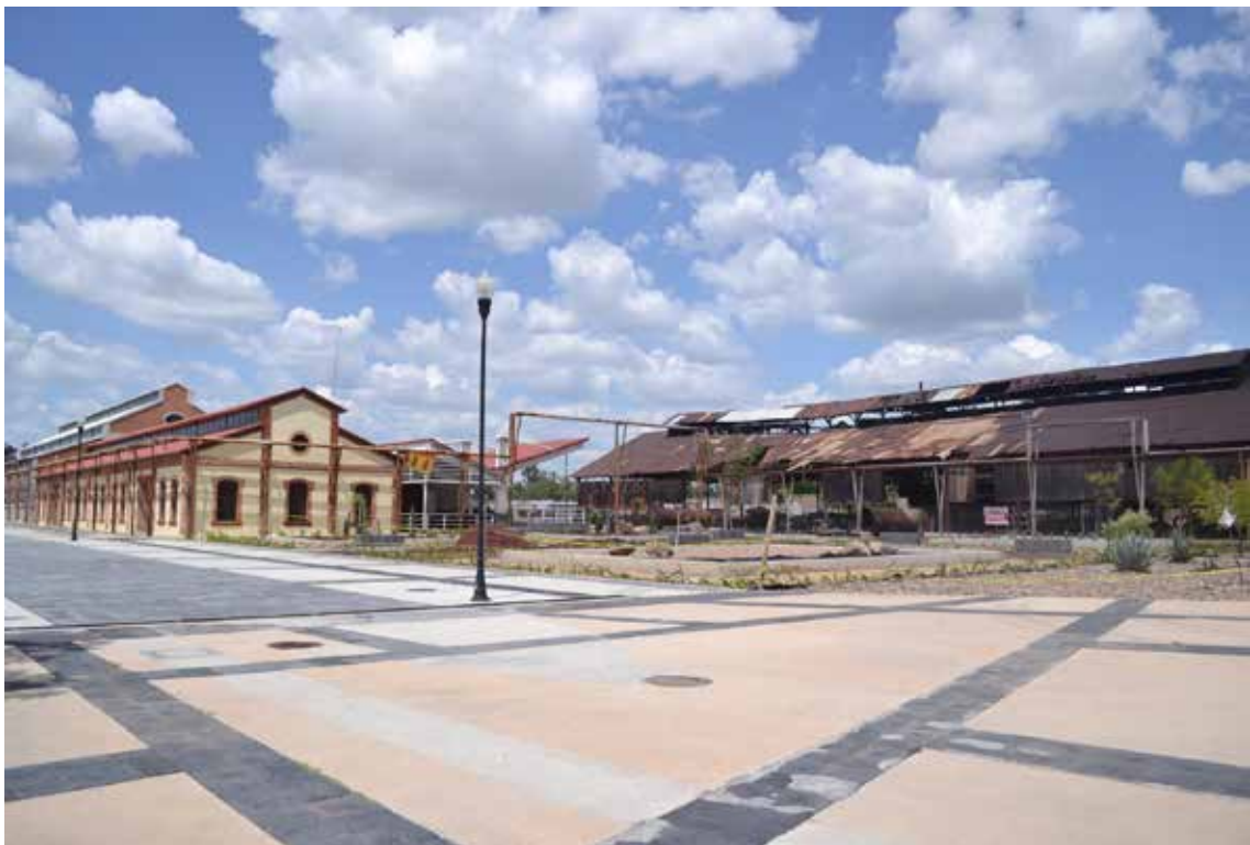
Figura 20. Vestigio de taller en el Antiguo Complejo Ferrocarrilero.