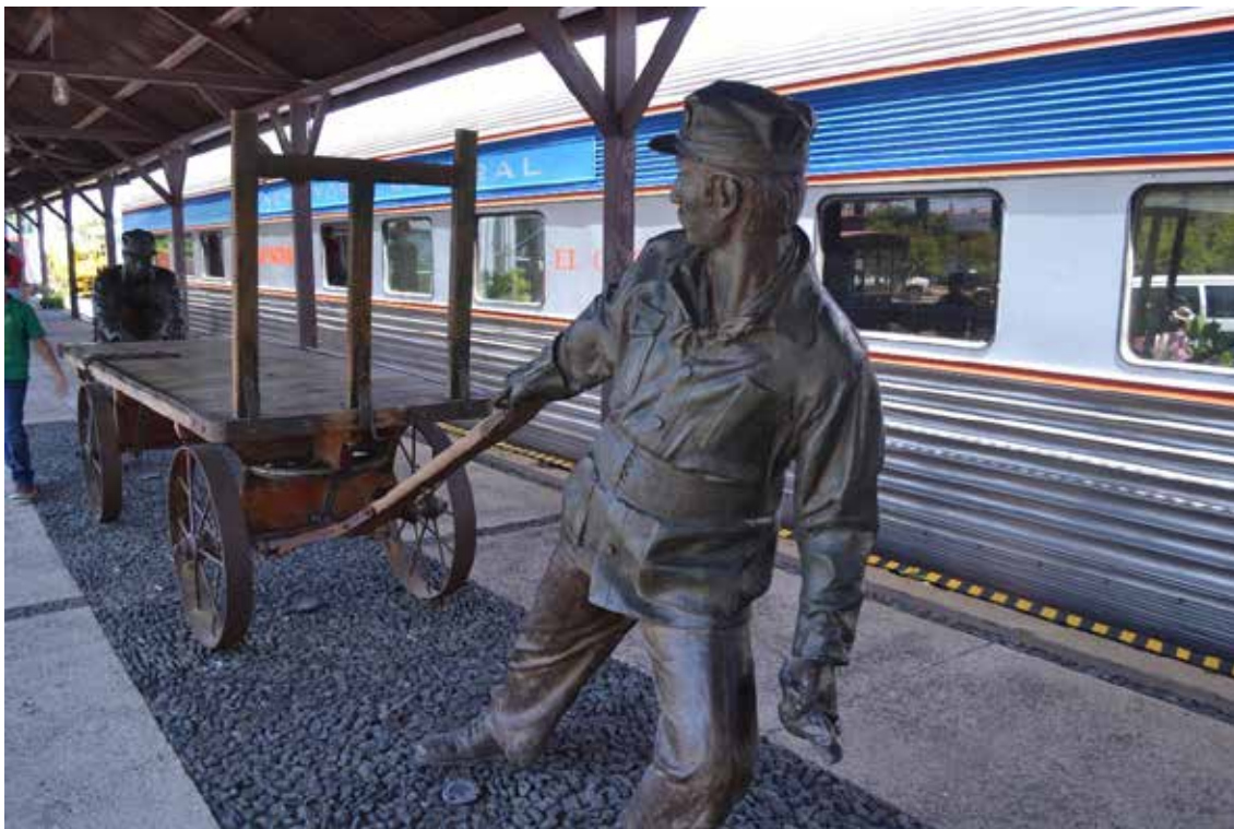
Figura 6. Escultura de ferrocarrilero. Demuestra las prácticas laborales de los obreros.

Por ende, lograr la conservación de algún sitio