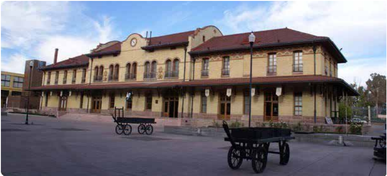
Figura 12. Museo Ferrocarrilero. Su finalidad es comunicar los aspectos sociales, económicos y políticos de la era ferroviaria. Adaptado de ©Gobierno del Estado de Aguascalientes, 2010b.