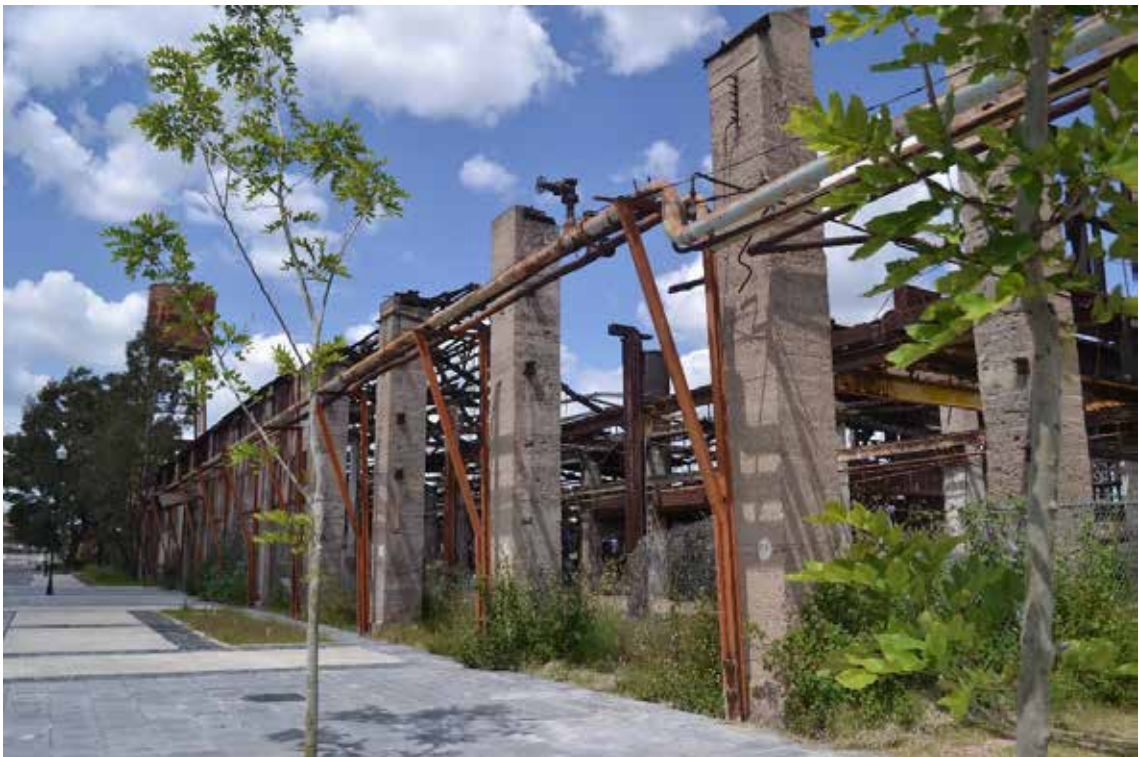
Figura 18. Vestigio de taller en el Antiguo Complejo Ferrocarrilero, ubicado en el MECA. Fotografía captada el 11-09-2016