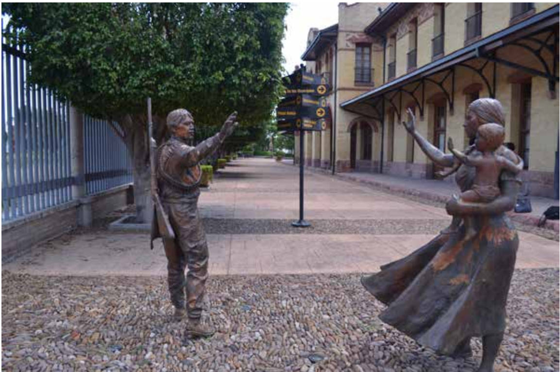
Figura 11. Escultura de viajero, ubicada en la Estación de Ferrocarriles. Demuestra el modo de vida.