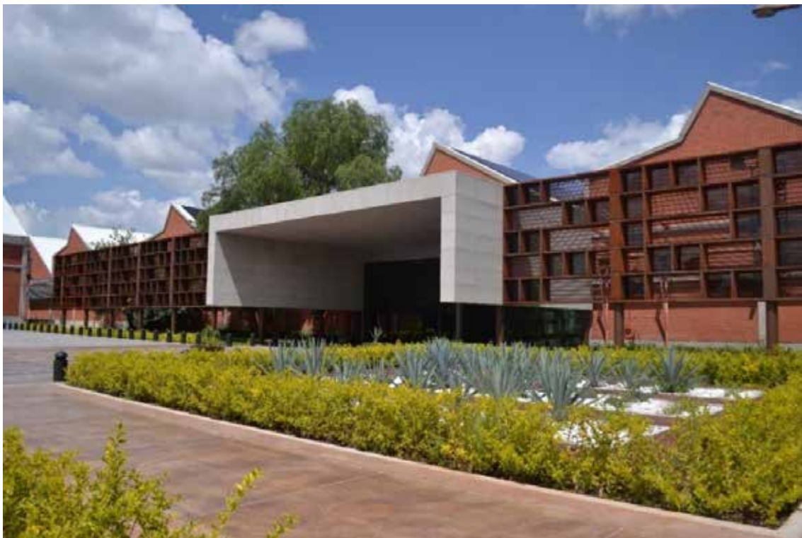
Figura 16. Museo-Espacio. Resguardaba los talleres de carpintería y mecánica.