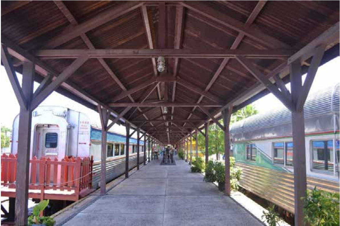
Figura 10. Restauración de la Estación de Ferrocarriles. Testimonio material del modo de vida de aquella época, de aquellos visitantes que acudían a la plaza.