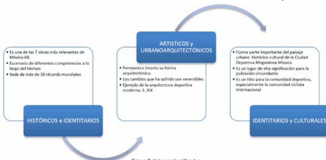
Figura 8. Valores identificados

Para preservar los valores que detenta el Velódromo Olímpico Agustín Melgar como patrimonio histórico y cultural, se necesita un adecuado plan de manejo que evite los excesos en el uso de sus espacios exteriores, el cual debe ser complementado por un proyecto de rehabilitación realizado con base en el diseño participativo, que restituya los elementos físicos y naturales perdidos susceptibles de hacerlo, y ponga al día y a la vanguardia sus instalaciones y los espacios que así convenga, sin que ello determine la pérdida de su integridad, autenticidad y excepcionalidad. Así, más allá de su espacialidad es imprescindible conservar los valores simbólicos de este patrimonio tangible, tanto históricos como identitarios y culturales.