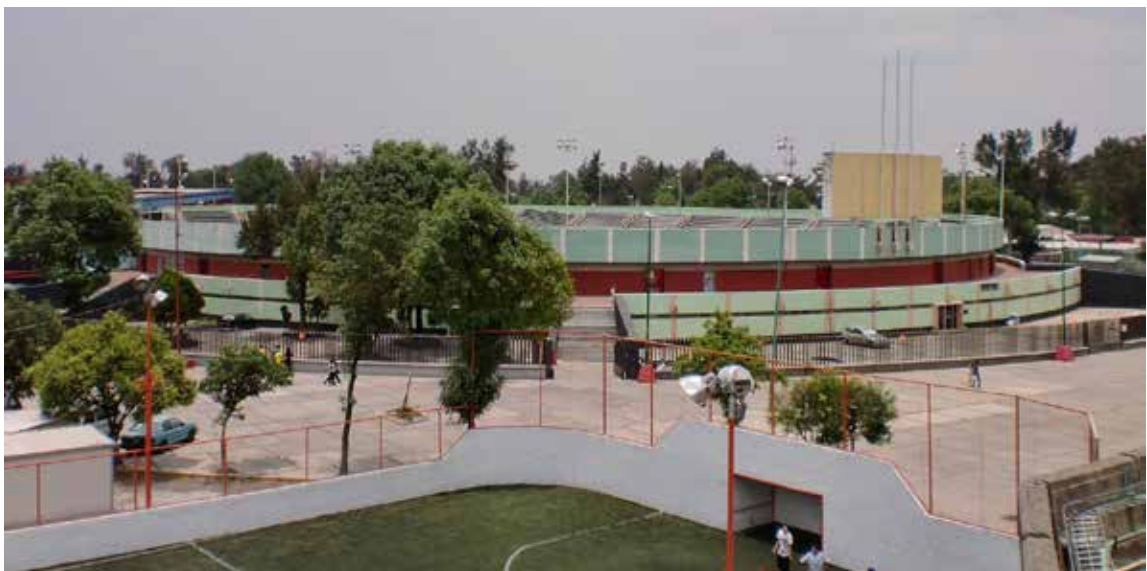
Figura 5. Vista aérea del Velódromo Olímpico Agustín Melgar dentro de la Ciudad Deportiva Magdalena Mixiuhca.

Por lo anterior, la transformación de un espacio público accesible a los ciudadanos que habitan la capital del país, en un espacio público concesionado a la iniciativa privada, limitaría la apropiación física y simbólica del mismo, hoy ocupado por el Velódromo Olímpico Agustín Melgar; un espacio público de acceso controlado que refuerza el