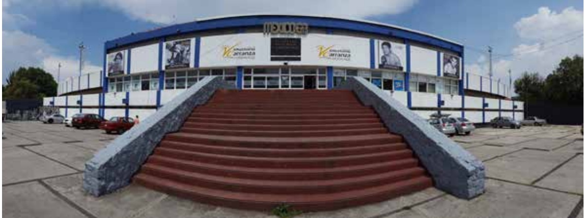
Figura 1. Fachada principal del Velódromo Olímpico Agustín Melgar.