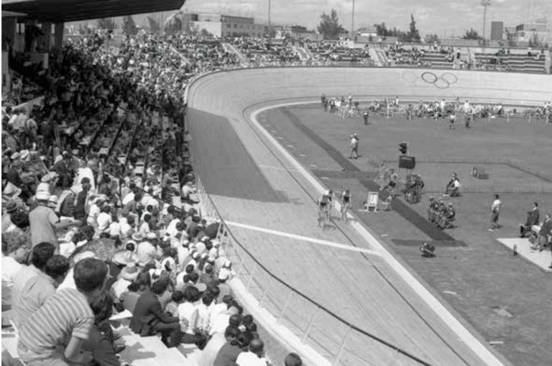
Figura 6. Competencias del ciclismo de pista de los Juegos Olímpicos de 1968, en el Velódromo Olímpico Agustín Melgar. Fuente: Fondo Fotográfico de los Hermanos Mayo, Archivo General de la Nación, 1968.

para el alto rendimiento, a lo cual se le suma que alberga la única escuela técnico deportiva de esta especialidad abierta a todo público en la urbe (Arizmendi Casas, 2017), impulsando una cultura integral del ciclismo.