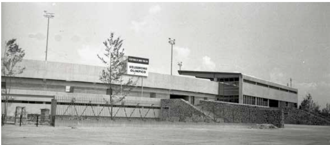
Figura 2. El Velódromo Olímpico Agustín Melgar, días antes de su inauguración el 13 de septiembre de 1968.

En su momento, la propuesta de demolición por parte de las autoridades estuvo basada en la supuesta obsolescencia del velódromo, derivado del cambio en la reglamentación de las pistas que las hacen más pequeñas, al pasar de 333 a 250 metros, y demandar que sean techadas para competencias internacionales, por lo que se consideró este predio como una alternativa para la nueva ubicación del Estadio Azul, cuya pertinencia económica lo convertía en una aparente mejor inversión como generador de recursos económicos, considerando el nuevo modelo de gestión público privada, que deja de lado sus valores patrimoniales y su estatus como la única pista de ciclismo de acceso público de la Ciudad de México, que además cuenta con gradas y sirve hoy en día para albergar competencias de ciclismo nacionales, entrenar a ciclistas amateurs y de alto rendimiento, quienes la prefieren para