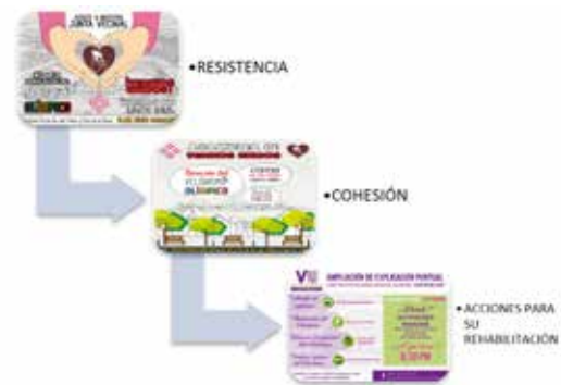
Figura 7. Carteles elaborados por los vecinos para la defensa del Velódromo Olímpico.

Más allá de su longitud, la integridad de la pista se mantiene intacta en su forma arquitectónica al permanecer casi sin cambios las gradas, los espacios arquitectónicos internos y la estructura, algo también excepcional sobre todo por su aspecto estético único, propio de la modernidad (a pesar de haber cambiado la pista de madera africana a cemento), así como por los cambios que han sufrido los espacios públicos abiertos en sus secciones enrejadas de su perímetro y la