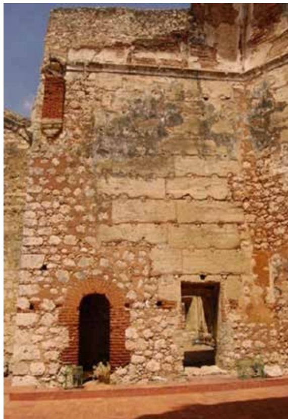
Figura 6. En San Francisco, construido en 1543, en la Ciudad de Santo Domingo, República Dominicana, se conservan los componentes de tapia a pesar de las condiciones climatológicas de la isla.

Sin embargo, en la primera fundación de la Villa Rica de la Vera Cruz sólo se ha podido documentar la presencia