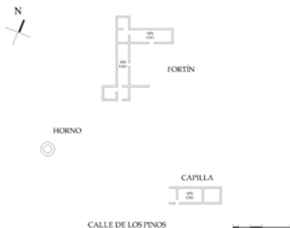
Figura 5. Plano de la Fortaleza, monumento principal de la fundación en la que convivieron hispanos y totonacos, al menos de 1519 a 1523, y que construyeron los conquistadores con ayuda de los indígenas. Plano resultado de la Exploración en la Villa Rica de la Veracruz. Dibujo: José A. Ochoa Acosta, 2014 para el Catálogo Nacional de Monumentos Históricos - INAH

transformada y en casos necesarios pasó por procesos de cocción que generaron materiales más resistentes y perdurables, como el ladrillo. Para el caso de los muros, la tierra debió ser empleada en su estado natural, sólo extrayendo la adecuada del terreno para poder compactarla y levantar así los muros.