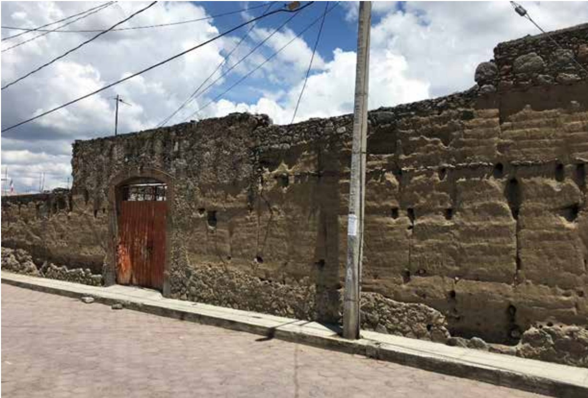
Figura 1. Vivienda tradicional de tapia en un barrio fundado en el siglo XVI, con paredes que presentan mechinales de las agujas. Barrio de San Lucas, Huamantla.

con otras técnicas constructivas de tierra, determina las características de los muros y la complejidad de una edificación que depende por completo de la compactación.