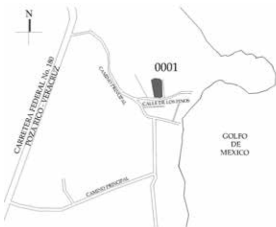
Figura 3. Localización de la antigua Villa de la Vera Cruz, en la que aún se conservan ruinas de los cimientos de lo que habría de ser la fortificación de la primera ciudad fundada por Hernán Cortés, y que conectaría a poco menos de dos kilómetros con el asentamiento de Quiahuiztlan. Dibujo José A. Ochoa Acosta, 2014, para el Catálogo Nacional de Monumentos Históricos-INAH.

La localidad de Villa Rica un asentamiento costero del municipio de Actopan, con una población no mayor a 170 habitantes. Por su ubicación, a 77 kilómetros de la ciudad de Veracruz, por tener frente de mar y por su cercanía a la zona arqueológica de Quiahuiztlan, es ocupada para establecer casas de fin de semana. De suelo regosol y vegetación de pastizal, fue el sitio donde, en 1519, se edificaría el primer emplazamiento ibérico en tierras mesoamericanas. Aquí, españoles y totonacas levantarían una iglesia y un recinto fortificado de los cuales todavía existen algunas ruinas (Figura 3). Es el sitio donde Hernán Cortés decide hundir sus naves para incursionar en la conquista de lo que sería la Nueva España.