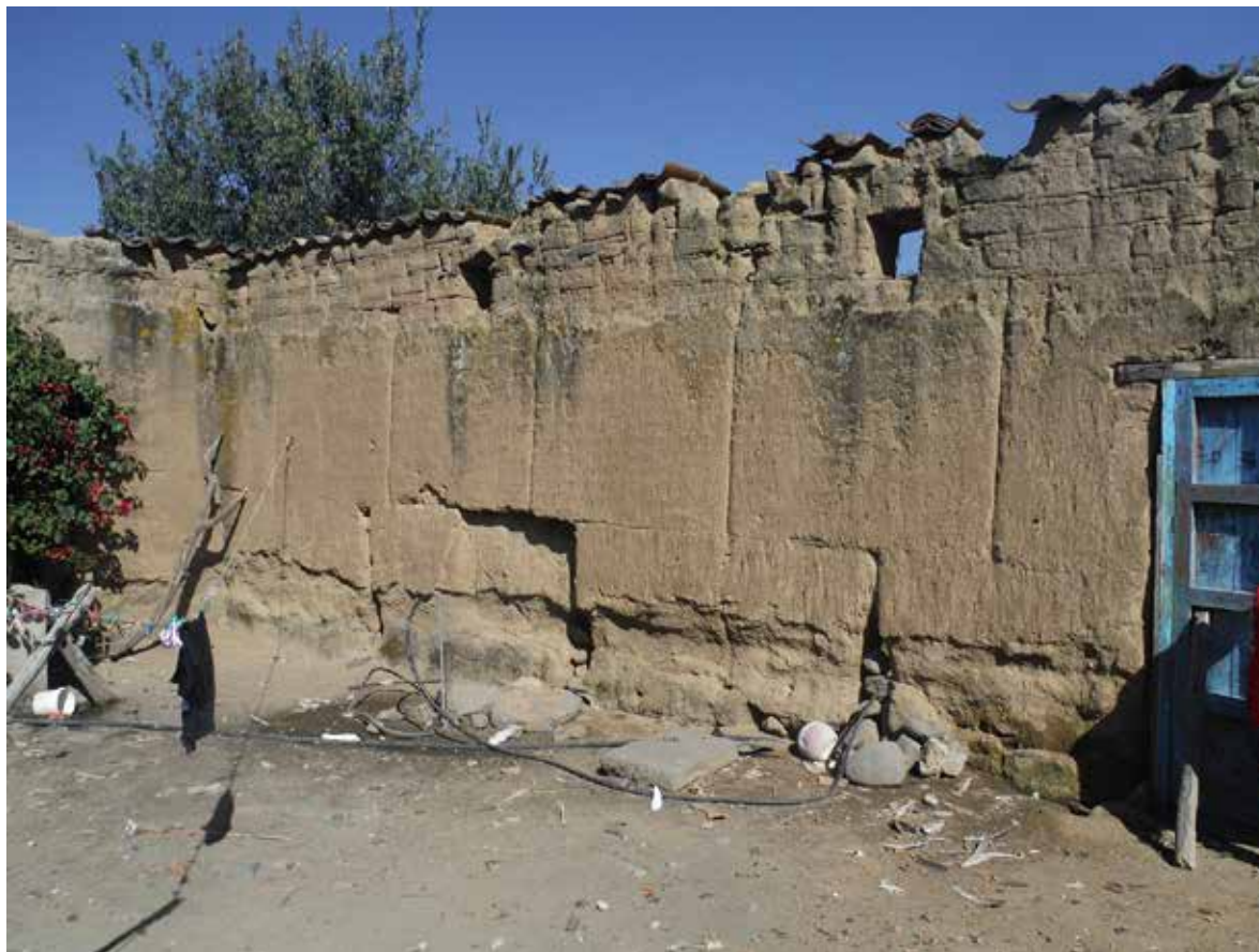
Figura 2. Barda perimetral de tapia con cerramientos de adobe, ubicada en el histórico poblado del siglo XVI de San Andrés Calpan, Puebla. Foto: Blas A. Tepale, 2017.

El análisis formal y técnico-constructivo, principalmente de muros que constituyen la estructura de los edificios, ha dejado ver que se trata de un sistema no nativo, que disrumió con los sistemas vernáculos del territorio — basados fundamentalmente en la construcción con bajareque y adobe—, lo cual dificultó su expansión. Sin embargo, se adaptó a las condiciones regionales a partir de la colonización española y la llegada de nuevos conocimientos edilicios europeos.