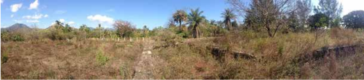
Figura 7. Restos del fortín de la Villa Rica de Vera Cruz, fundada por Cortés en el año de 1519, que permiten apreciar sólo partes de la cimentación de piedra, lo único que subsiste actualmente. No hay evidencia de los muros.