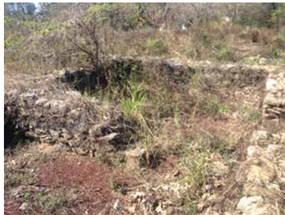
Figura 9. Vestigios de lo que fue una primera capilla de la localidad de Villa Rica Foto: José A. Ochoa Acosta, 2014.

En un predio de la actual calle De los pinos, se localizan tres basamentos que datan del siglo XVI, que fueron elaborados de mampostería de piedra. A decir de los lugareños, la primera estructura corresponde a la cimentación de una capilla (Figura 9). El grosor de la subestructura es de 50 a 60 centímetros, y se puede observar que la planta arquitectónica era rectangular, dispuesta en dos espacios.