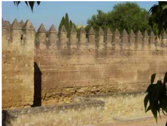
Figura 4. Varios lienzos de la muralla que rodea la ciudad de Córdoba en España, la cual muestra tapias originales.

Pero para los fines del presente texto, es fundamental resaltar el empleo del término “tapias”. Es el testimonio sobre lo que parece ser el empleo de un método constructivo que los hispanos dominaban a la perfección, ya que desde la Edad Media se solía utilizar.