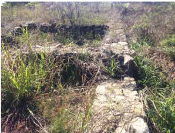
Figura 8. Vestigios de lo que fue una primera edificación defensiva en la localidad de Villa Rica